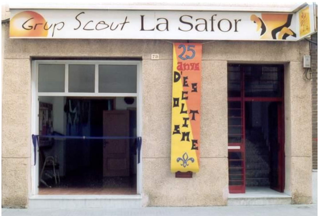
2003/Febrero_Inauguración local G.S. La Safor (Gandía)