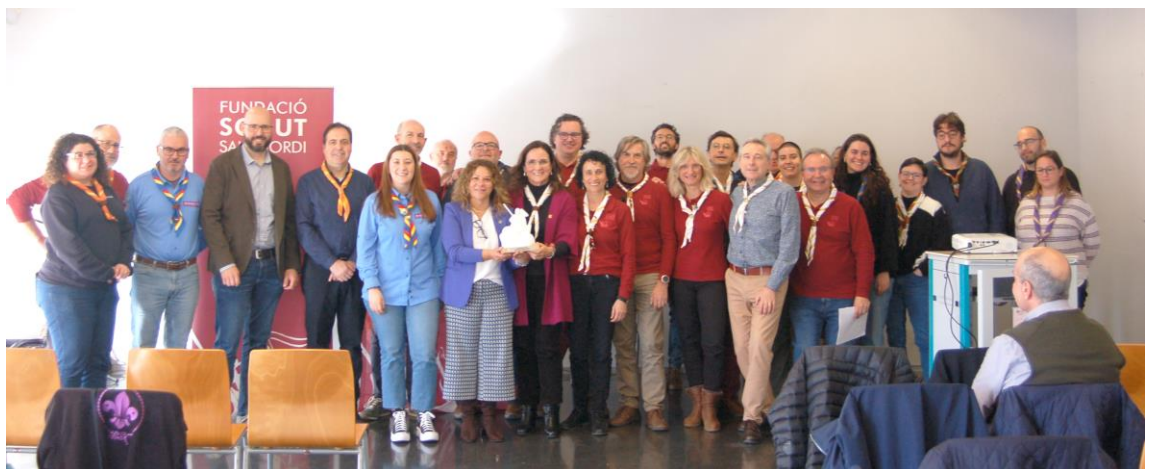
10/2/2024 Premio Sant Jordi a Mensajeros de la Paz de la Comunidad Valenciana