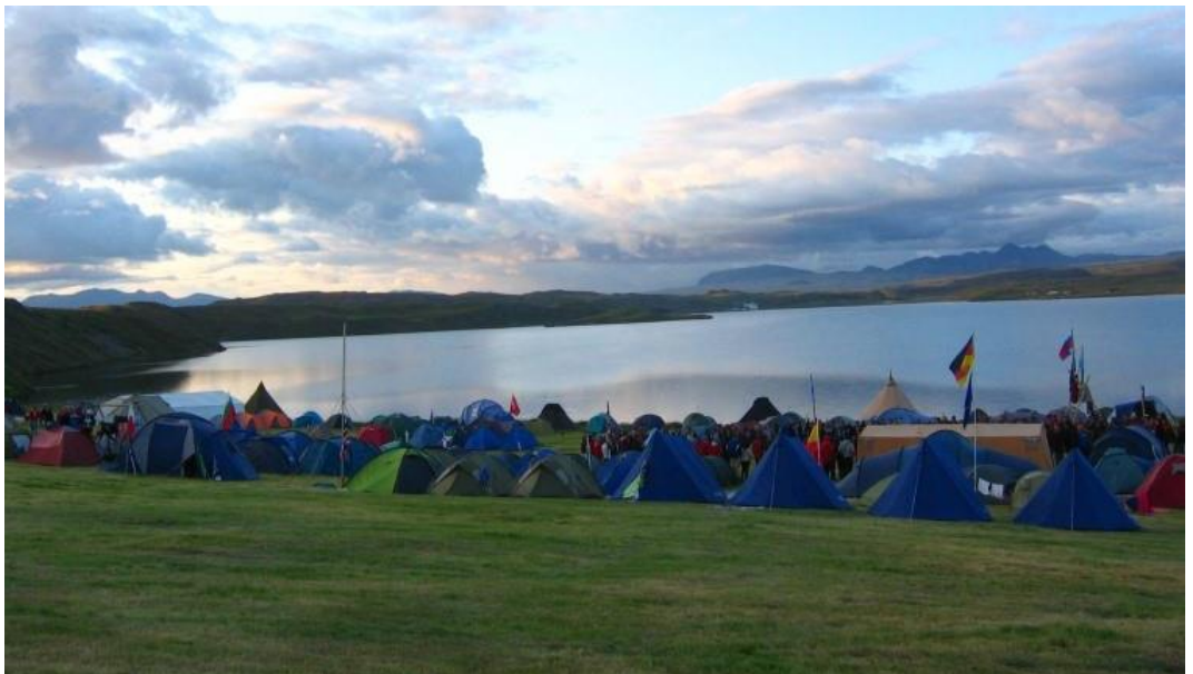
2º Premio fotográfico 'Objectius' Carles Oviedo - A.E. Sant Jordi l'Olleria - DIA SENSE NIT