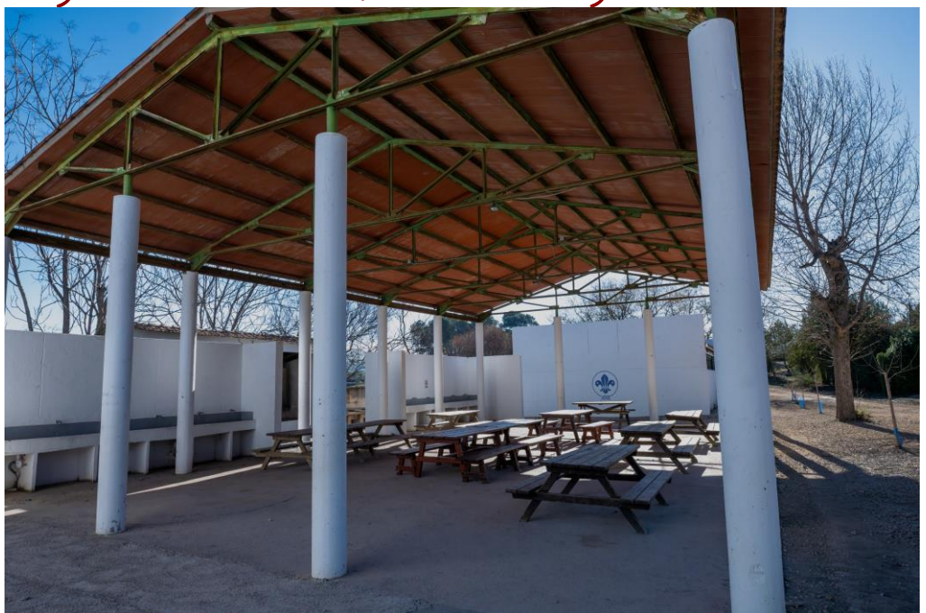
Casa Oràa. Comedor exterior

Gracias a la cesión de Cáritas, se inició en mayo de 2013 un proceso de voluntariado para la rehabilitación del centro que hoy en día tiene un campamento para 200 personas, un refugio para 18 y un albergue para 50.