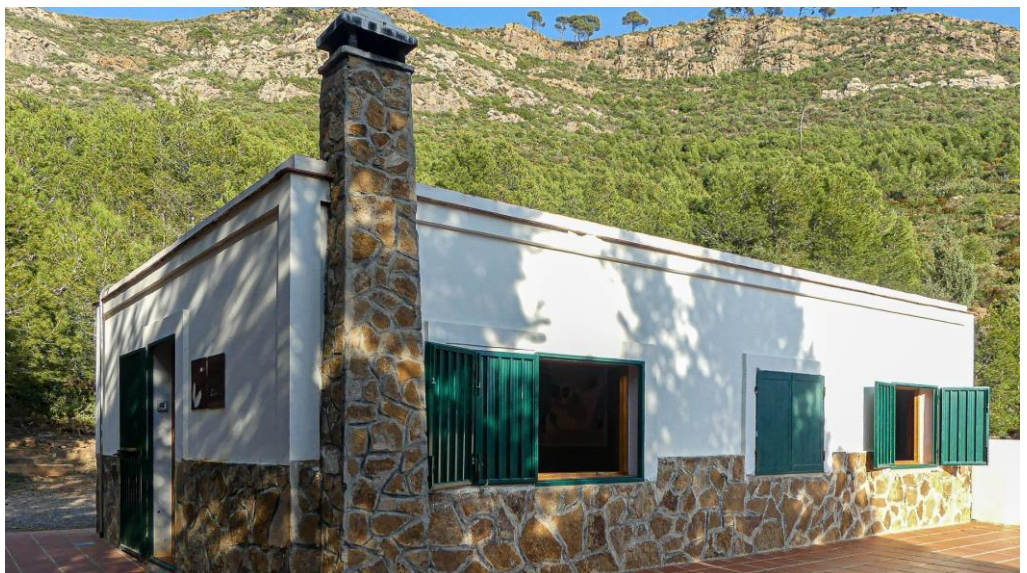
Casa Morería. Planta alta