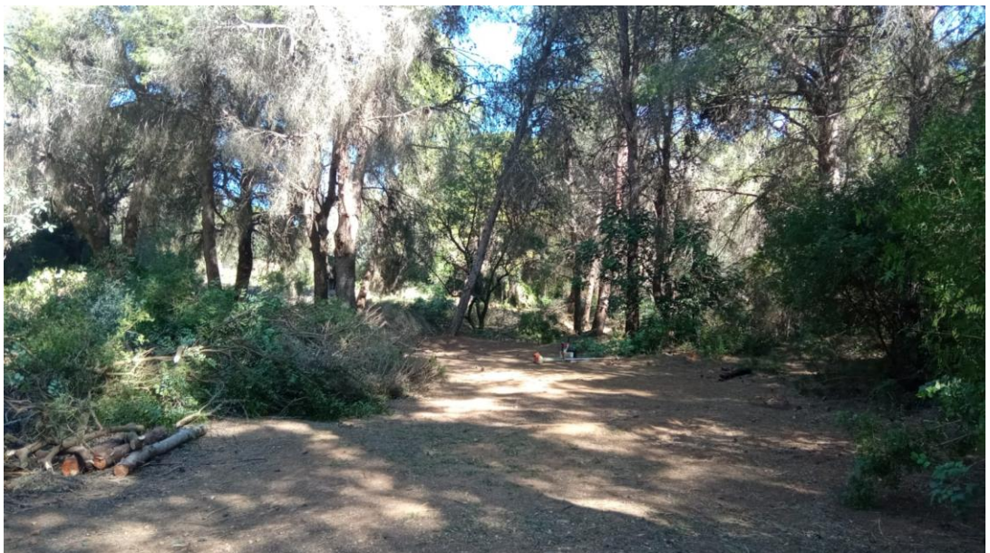
Zona acampada l'Almud. Picassent

En la actualidad, el proyecto se encuentra en proceso de aprobación por la Conselleria de la Declaración de Interés Comunitario como Zona de acampada.