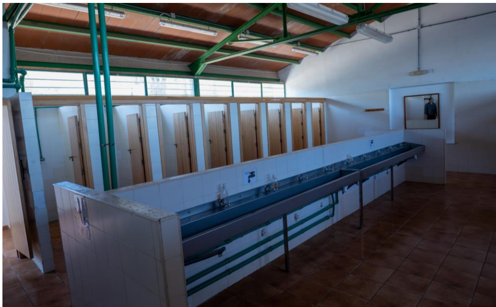
Casa Oràa. Baños y duchas