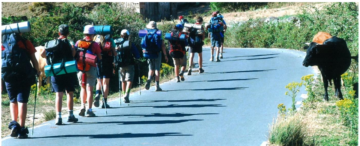
2009_Fent Camí. 1er premio Artística

Todo ello, considerando que el escultismo es una herramienta idónea para conseguir los objetivos anteriores.