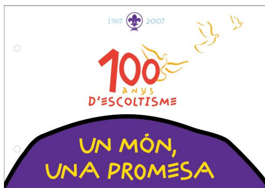
2007 Publicación CD música scout