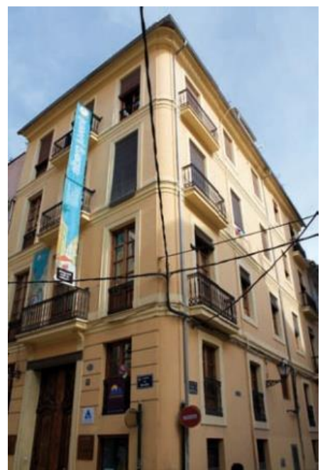
13/2/2002_Inauguración Albergue y sede FEV. C/Balmes, 17 (Valencia)