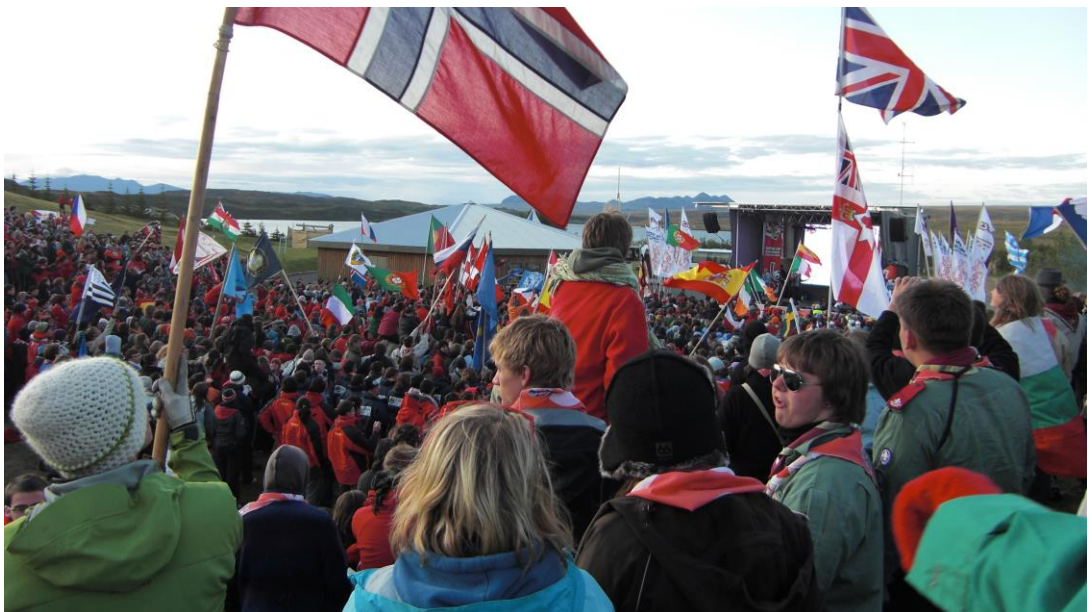
2009 Roverway en Islandia