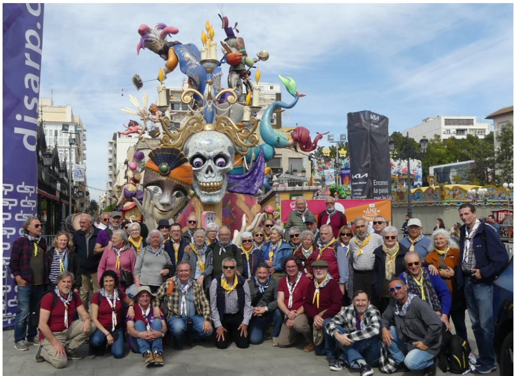
2024 Participantes en el encuentro Falla Plaça Prado, Gandia (Valencia)